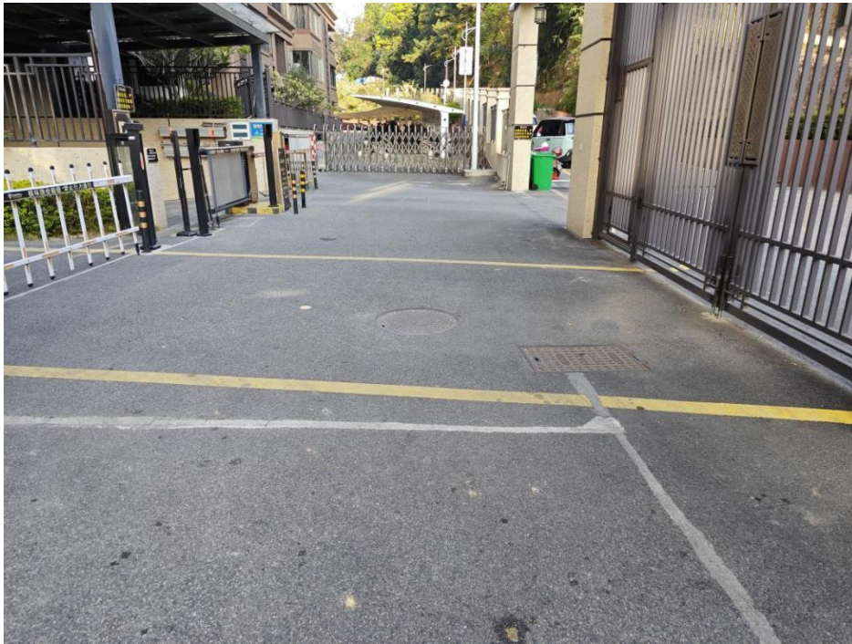
建设后典型附图（小区内部雨水管网）

注：请使用电脑编辑打印或正楷字体填写本鉴定书，加盖单位公章后报送。备案内容将在漳平市政府网水利窗口上公告，申请单位需对材料的真实性、准确性和可靠性负责，若材料中存在虚假、伪造等违法违规情况，应承担一切法律责任。