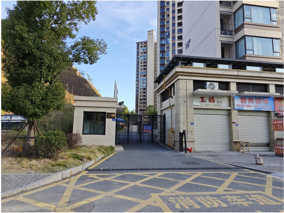
建设后典型附图（北侧出入口）