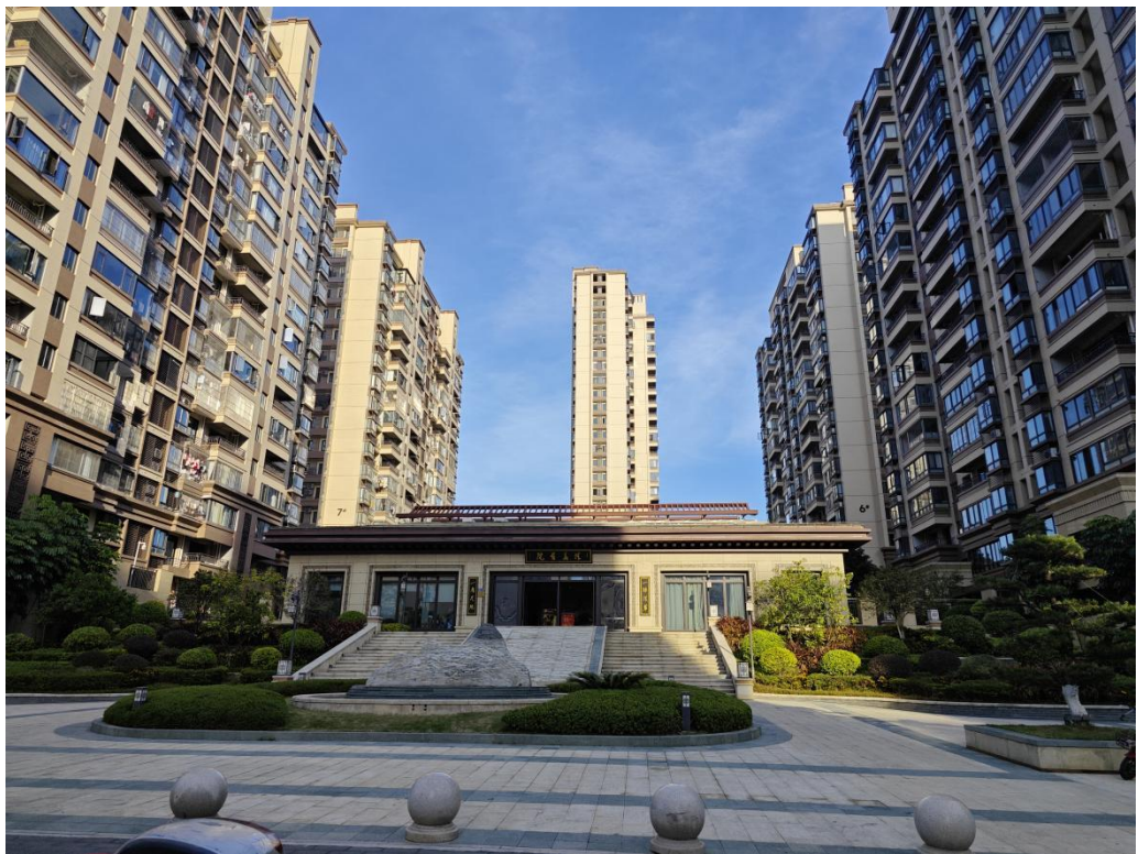
建设后典型附图（西侧主出入口）