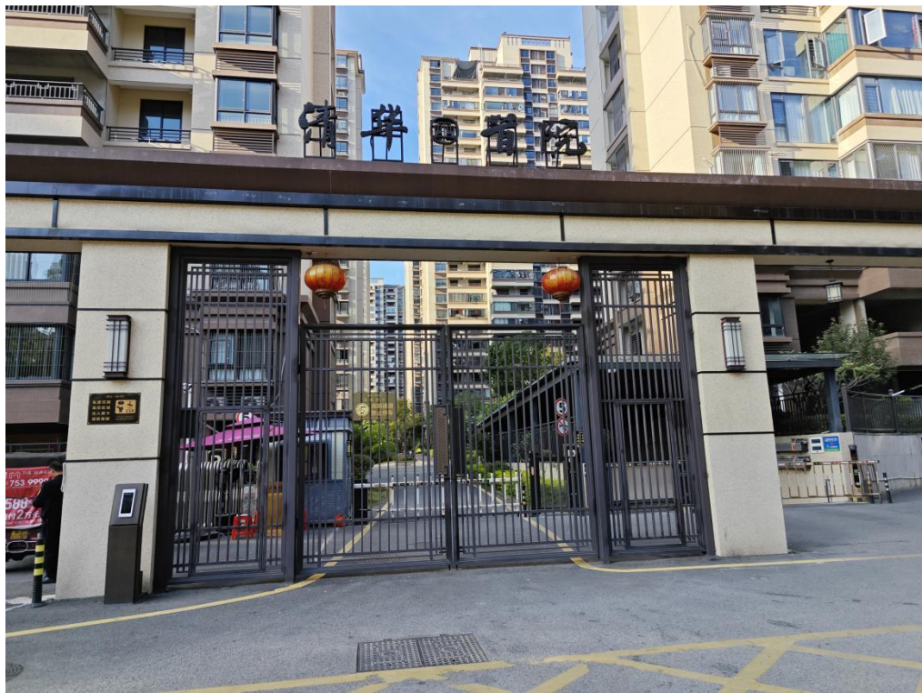
建设后典型附图（南侧出入口）