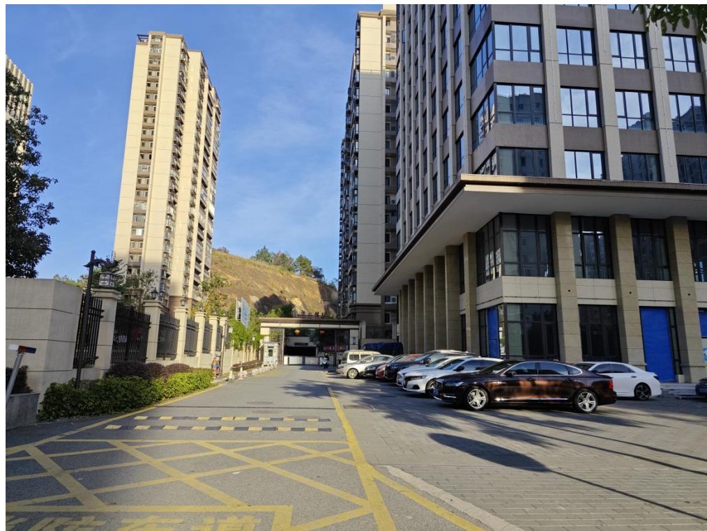
建设后典型附图（东北侧出入口）