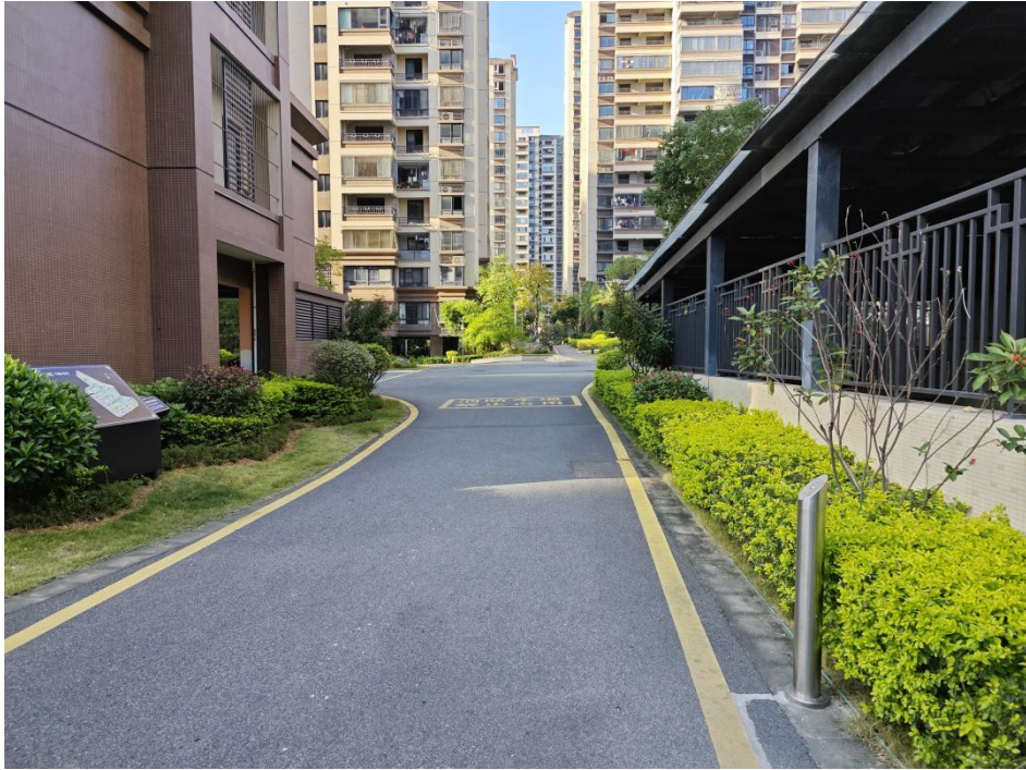
建设后典型附图（小区内部绿化）