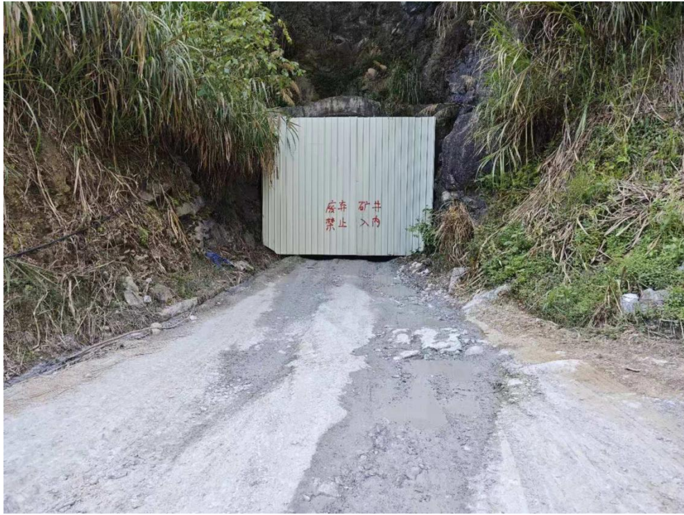
已封闭 PD3 硐口