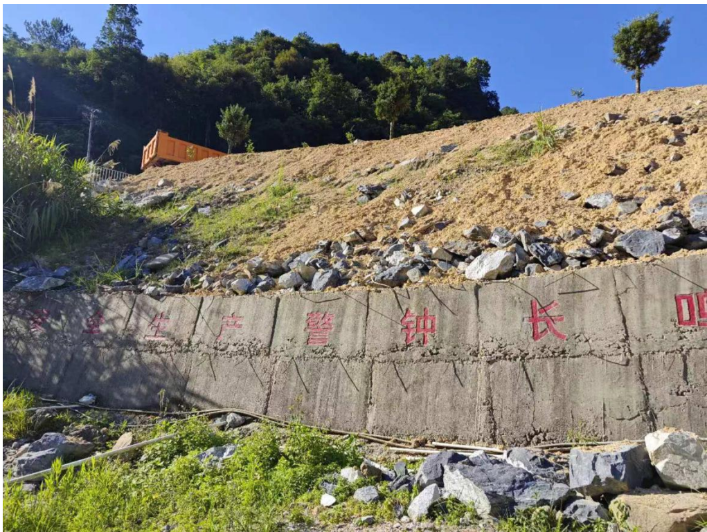
工业广场拦挡、临时覆盖图